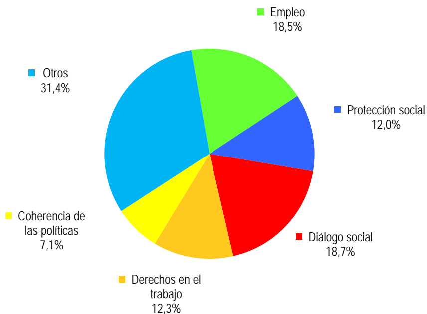
GRÁFICO A: INGRESOS PROCEDENTES DE LAS ACTIVIDADES POR OBJETIVO ESTRATÉGICO (AL 30 DE JUNIO DE 2012)