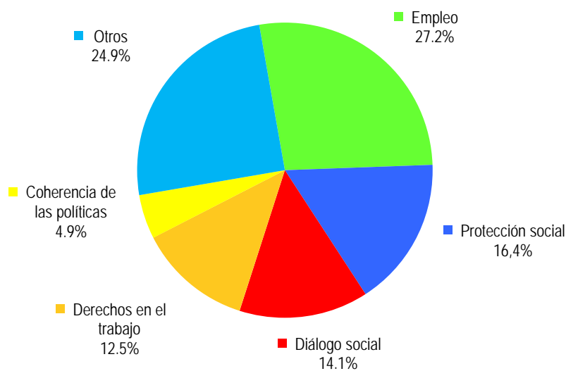
GRÁFICO A: INGRESOS PROCEDENTES DE LAS ACTIVIDADES POR OBJETIVO ESTRATÉGICO (AL 30 DE JUNIO DE 2013)